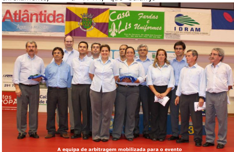
A equipa de arbitragem mobilizada para o evento

medidas e princípios orientadores que, do nosso ponto de vista, são muito positivos e promissores em relação ao futuro. Todavia, temos consciência das dificuldades, por isso vamos aguardar com calma para que, ao longo do mandato, a Federação possa apresentar muitas melhorias no seu