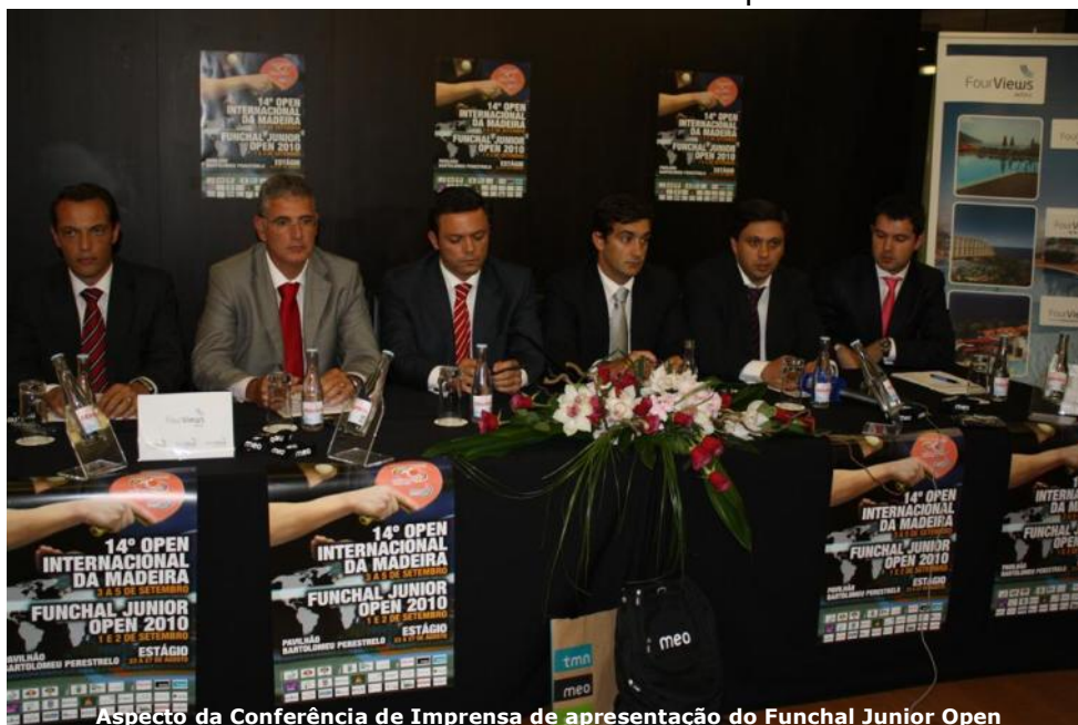
Aspecto da Conferência de Imprensa de apresentação do Funchal Junior Open

fizeram com que as instâncias internacionais da modalidade olhassem para nós "com outros olhos". Neste âmbito, o título de Campeão da Europa de Singulares Cadetes, conquistado por Marcos Freitas em 2002 (Moscovo), e a organização, em 2004, da Fase Final do Circuito Mundial de Juniores e do Desafio Mundial de Cadetes, contribuíram muito para que actualmente a cidade do Funchal continue a receber esta prova do Circuito Mundial de Juniores. Por outro lado, e antes de 2002, a participação positiva dos clubes madeirenses nas competições europeias, assim como a realização do Open Internacional da Madeira, permitiram mostrar a qualidade técnica do nosso Ténis de Mesa, assim como a nossa capacidade organizativa de eventos desportivos. Portanto, todos estes