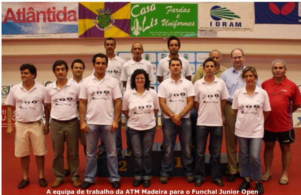
A equipa de trabalho da ATM Madeira para o Funchal Junior Open

diferentes áreas (Competição, Formação, Promoção, Instalações, Economia e Finanças), esta Associação pretende introduzir algumas alterações no quadro competitivo regional, tendo como paradigma proporcionar uma maior felicidade aos vários agentes da modalidade, assim como aos encarregados de educação.